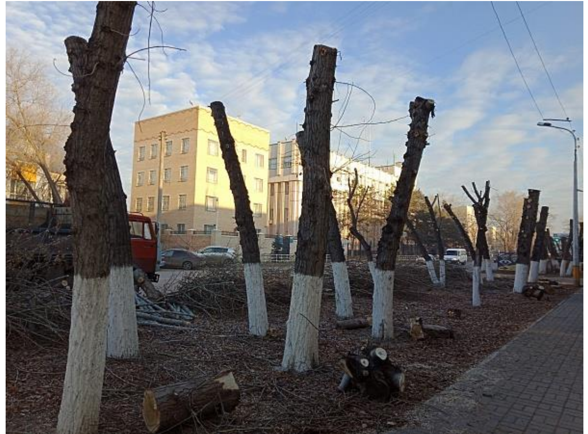
✗ Неправильная обрезка